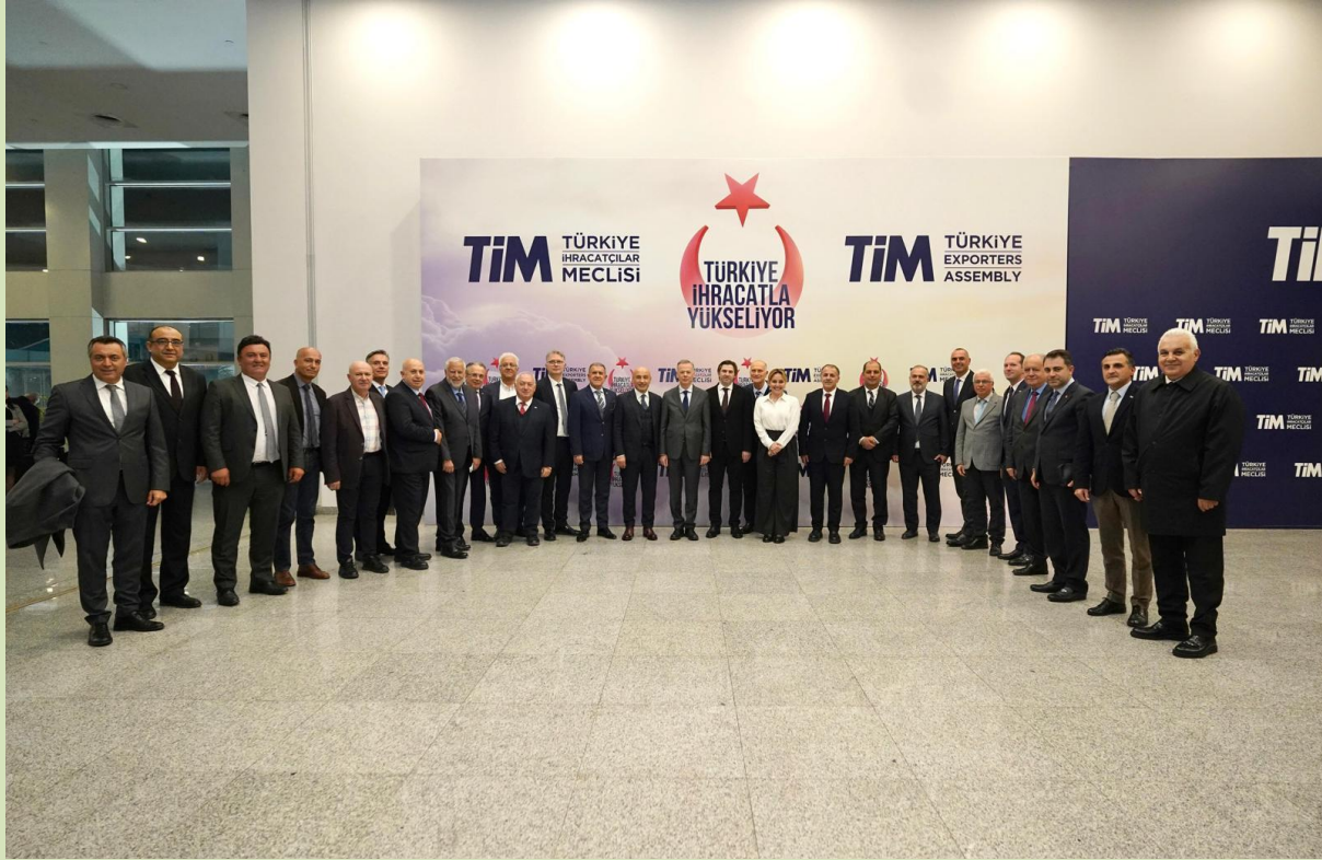
TİM Tarım Kurulu İftar Programı - İstanbul